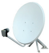
Beispiel einer Parabolantenne

In jeder Wohnung ist mindestens ein TV-Anschluss vorhanden. Sie möchten diesen in Ihrer Wohnung nutzen? Blättern Sie gerne ans Ende Ihrer Mietermappe, dort finden Sie ausführliche Informationen zur TV-Vielfalt der ServiceHaus.