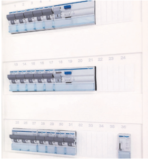
Beispiel eines Stromkastens