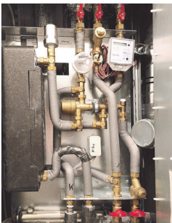
Beispiel einer Absperrvorrichtung

Sie können unnötige Kosten vermeiden, wenn Sie die Telefonnummer wirklich nur im Notfall anrufen. Eine Übersicht der gültigen Notfälle finden Sie im Mieterordner unter GBG NOTDIENST.