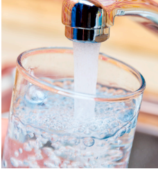
Beispiel eines Wasserhahns