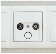
Beispiel eines TV-Anschlusses