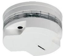
Beispiele verschiedener Rauchmelder