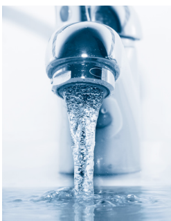
Beispiel eines Perlators

Um ein Blockieren der Hebel zu verhindern, schließen und öffnen Sie zwei Mal im Jahr für kurze Zeit die Absperrvorrichtung. Achtung: In dieser Zeit darf Ihre Waschmaschine, Spülmaschine oder Heizung nicht im Betrieb sein.