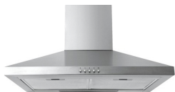
Beispiel einer Dunstabzugshaube

Wechseln Sie die Filtermatte in den Abluftventilatoren. Das geht so: Nehmen Sie die Kunststoffabdeckung ab, dann können Sie die Filtermatte auswechseln, dazu brauchen Sie kein Werkzeug. Sie brauchen eine neue Filtermatte? Sie können im Kunden-Service-Center (KSC) oder im Baumarkt eine Neue kaufen.