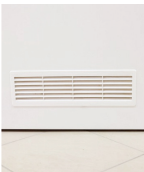
Beispiel eines Lüftungsgitters

Der Einsatz von Dunstabzugshauben ist grundsätzlich nur im Umluftbetrieb gestattet. Ein Anschluss an Schornsteinen und Abluftschächte ist verboten.