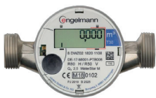
Beispiele verschiedener Messgeräte